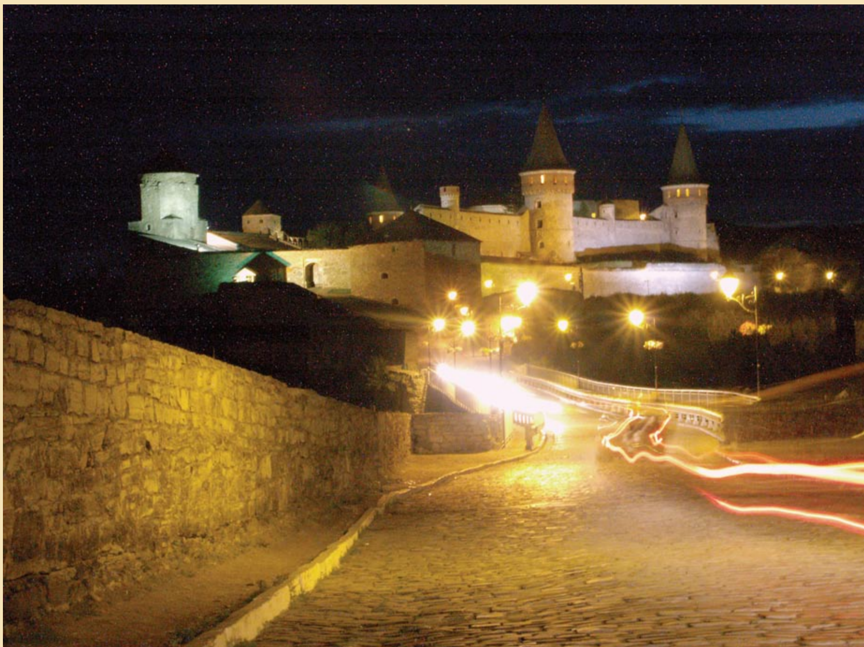
Zamek obronny w Kamieńcu Podolskim