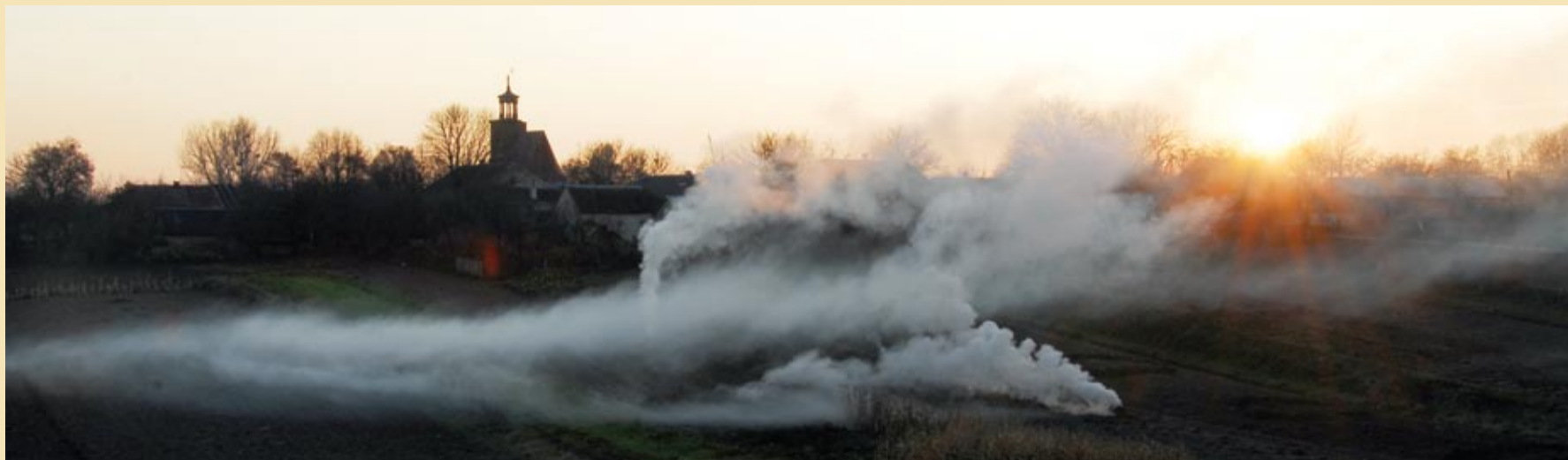
Jesienne motywy