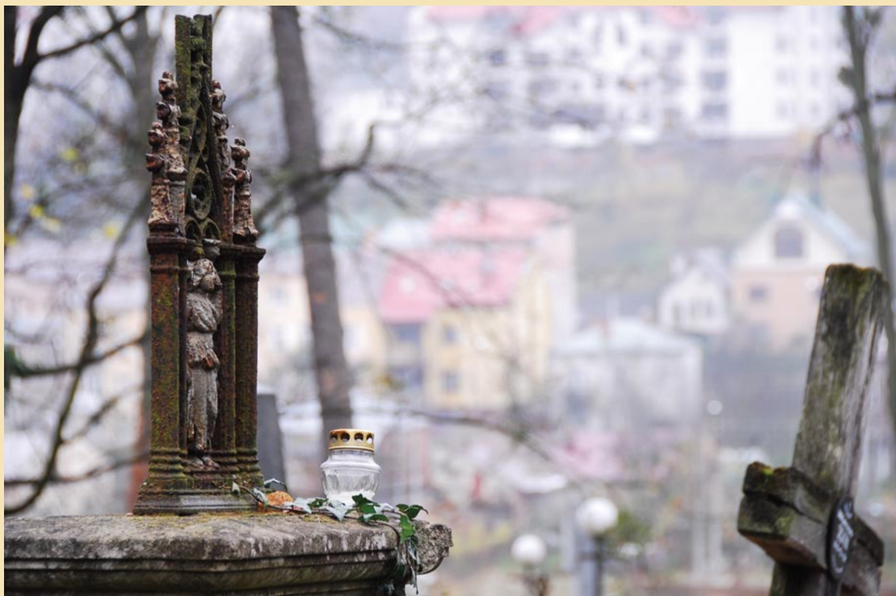
Nagrobek na Cmentarzu Łyczakowskim we Lwowie