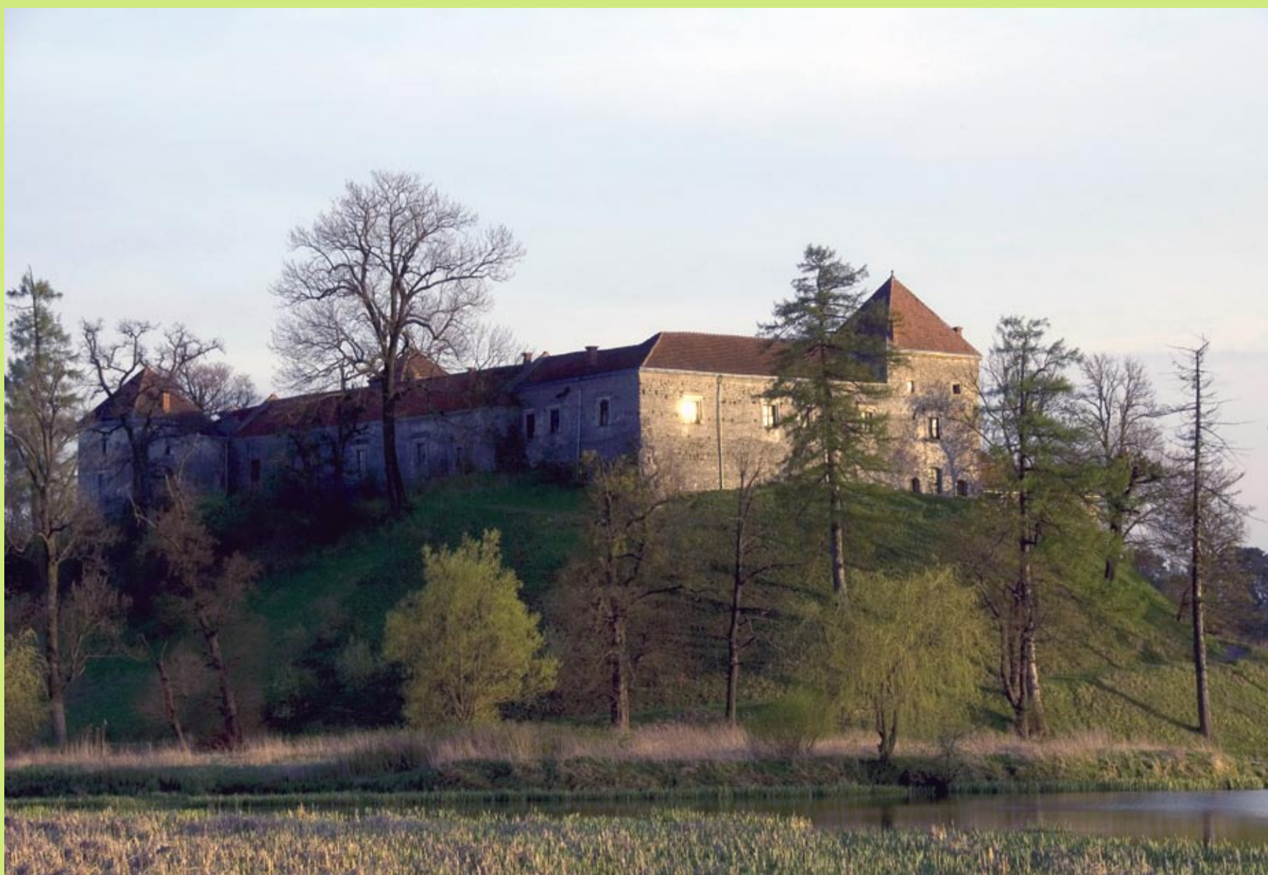
Zamek w Świrżu