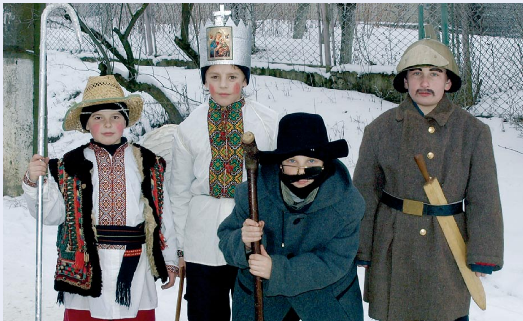
Kołodnicy w Otyni