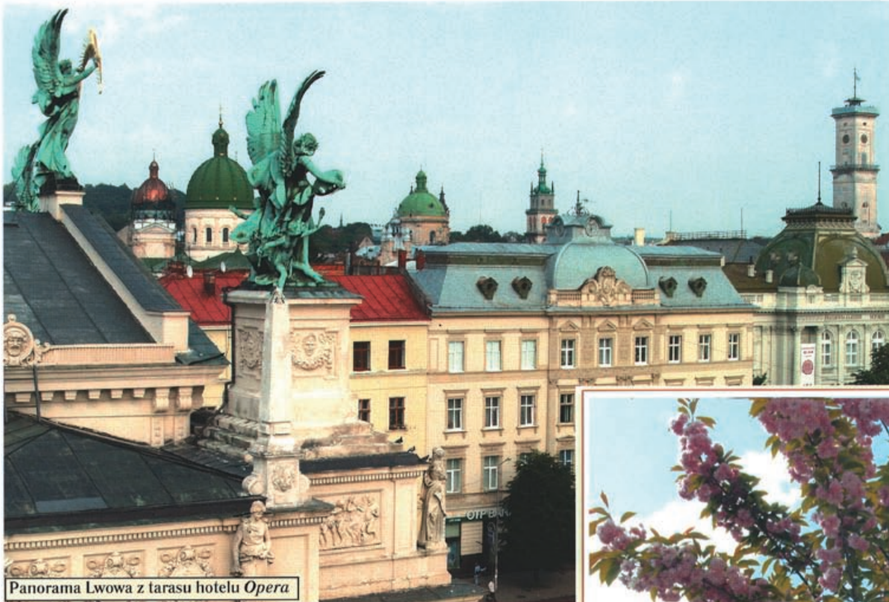
Panorama Lwowa z tarasu hotelu Opera