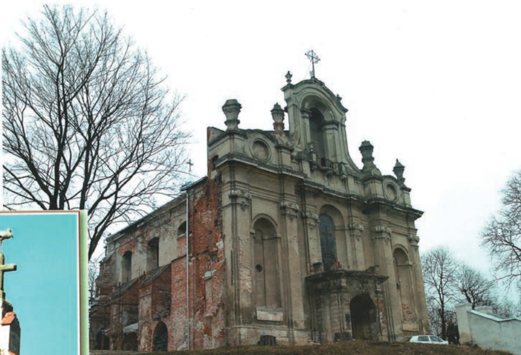
Sanktuarium NMP w Boleszowcach. Podczas rządów władzy radzieckiej zostało zamienione na magazyn nawozów sztucznych i chlew