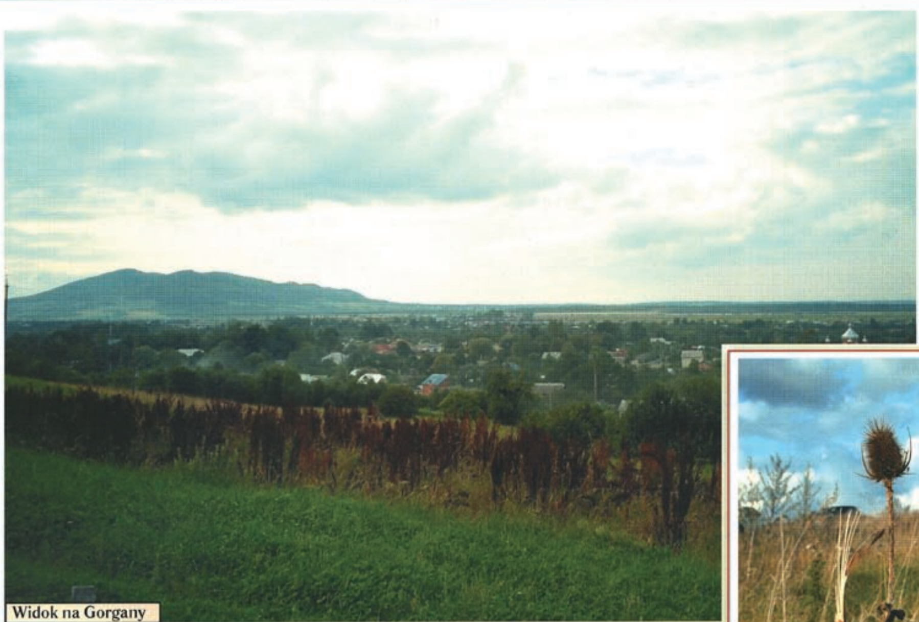
Widok na Gorgany