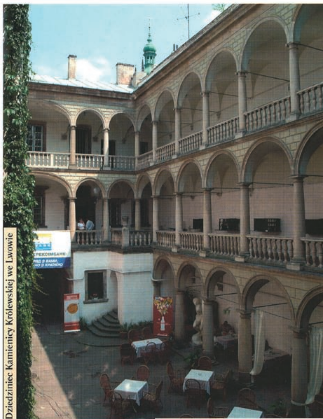
Dziedziniec Kamienicy Królewskiej we Lwowie