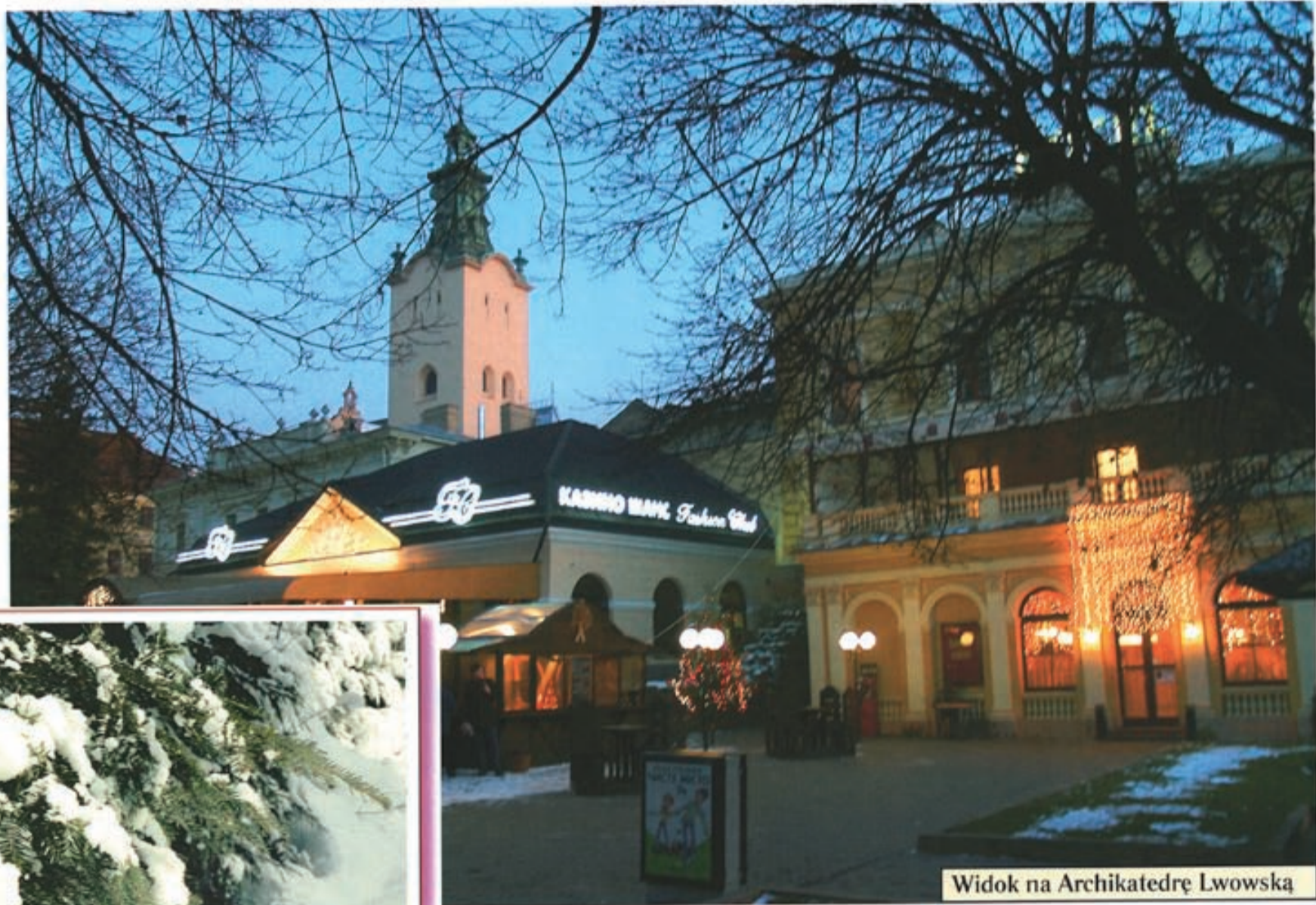
Widok na Archikatedrę Lwowską