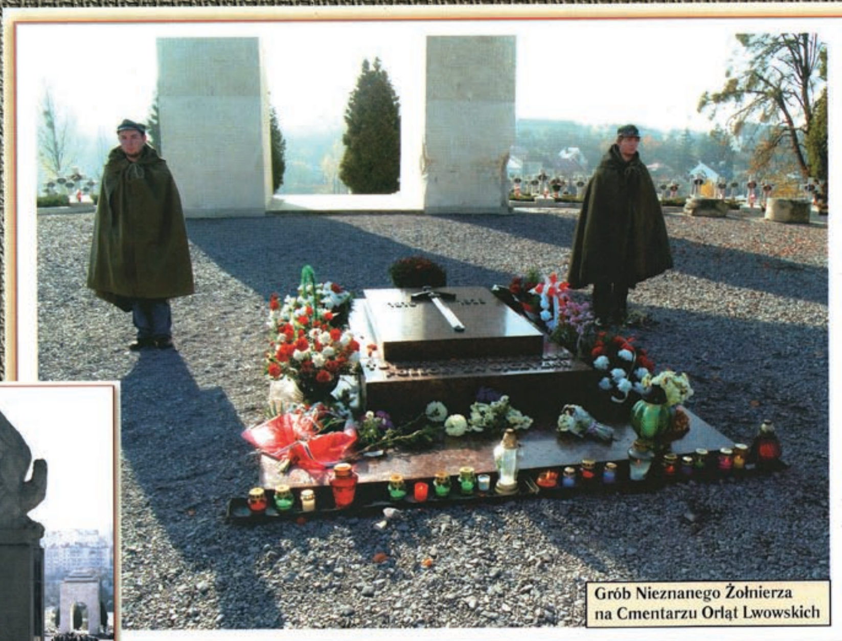
Grób Nieznanego Żołnierza na Cmentarzu Orłąt Lwowskich