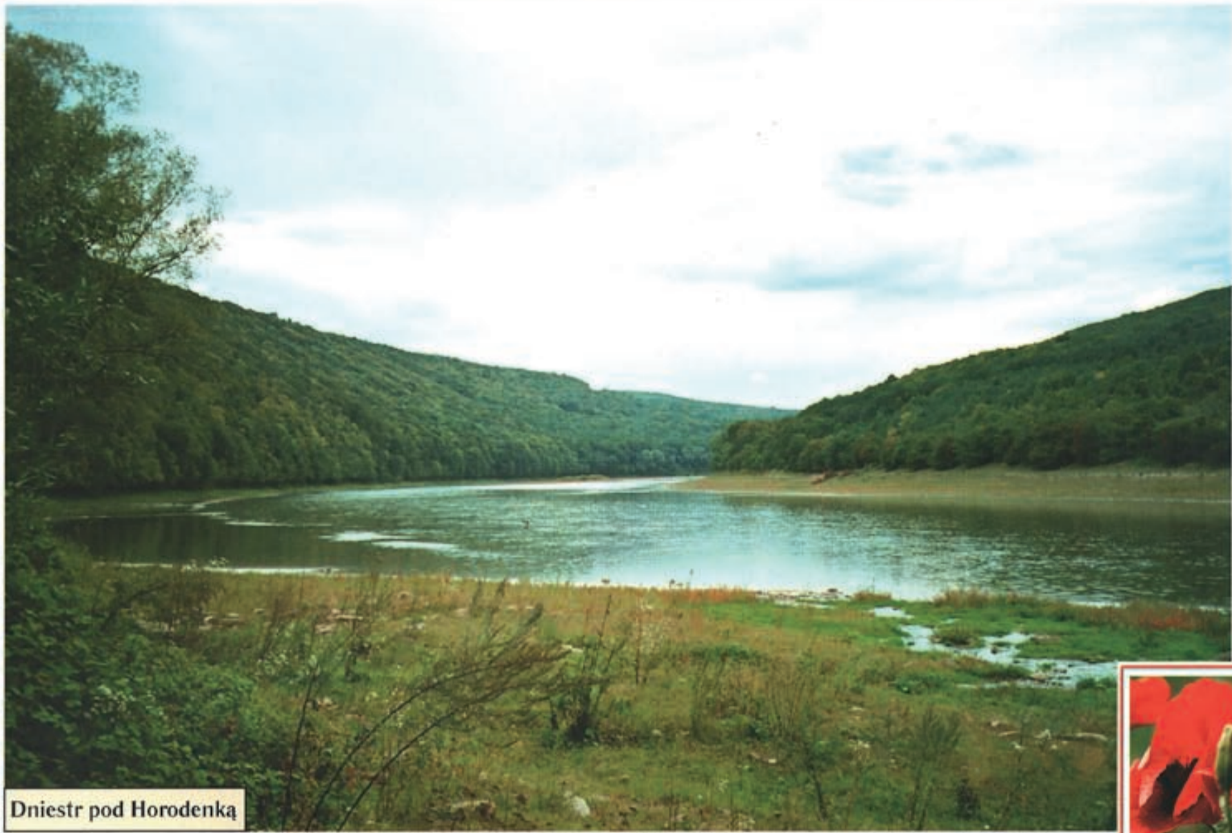
Dniestr pod Horodenką