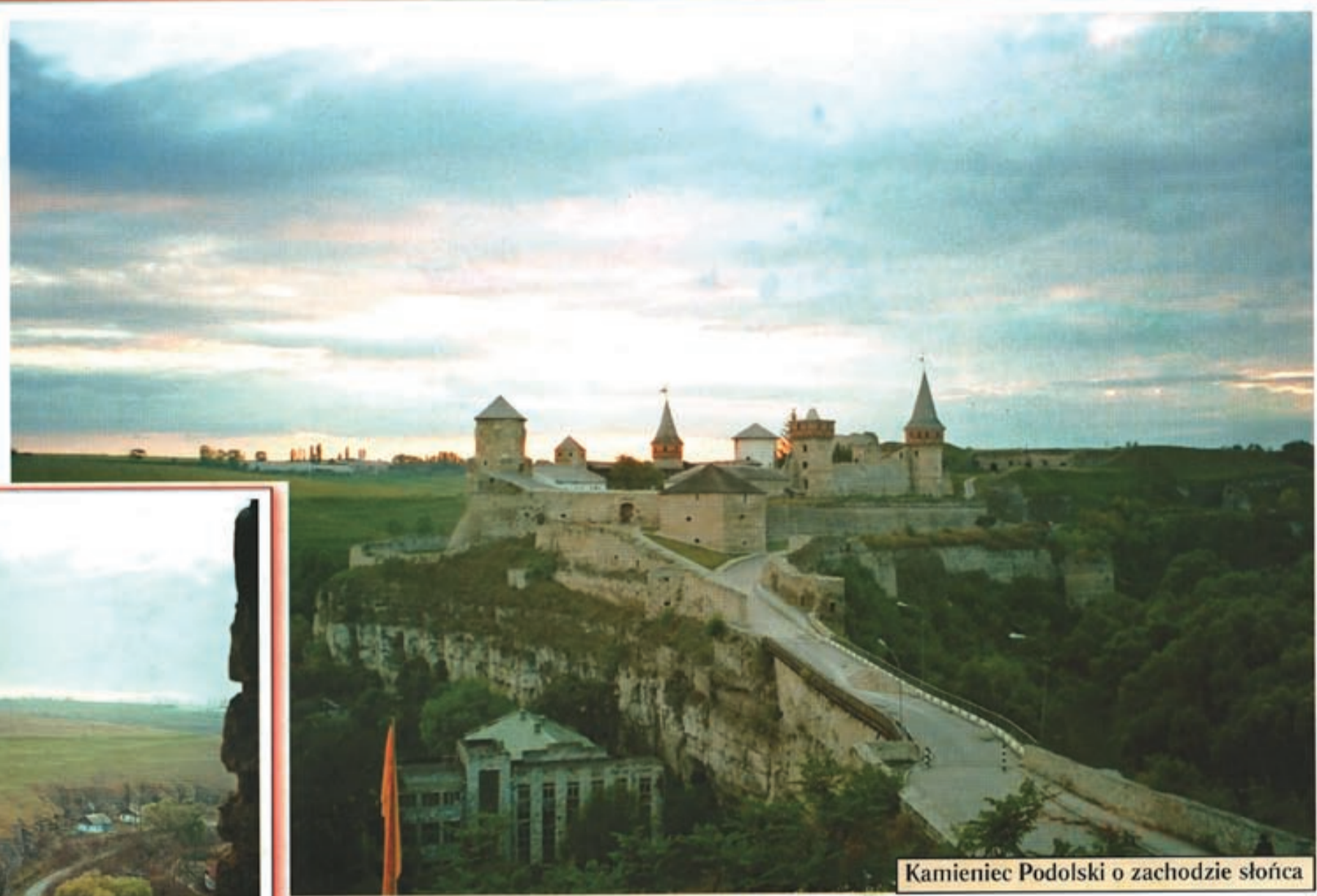
Kamieniec Podolski o zachodzie słońca