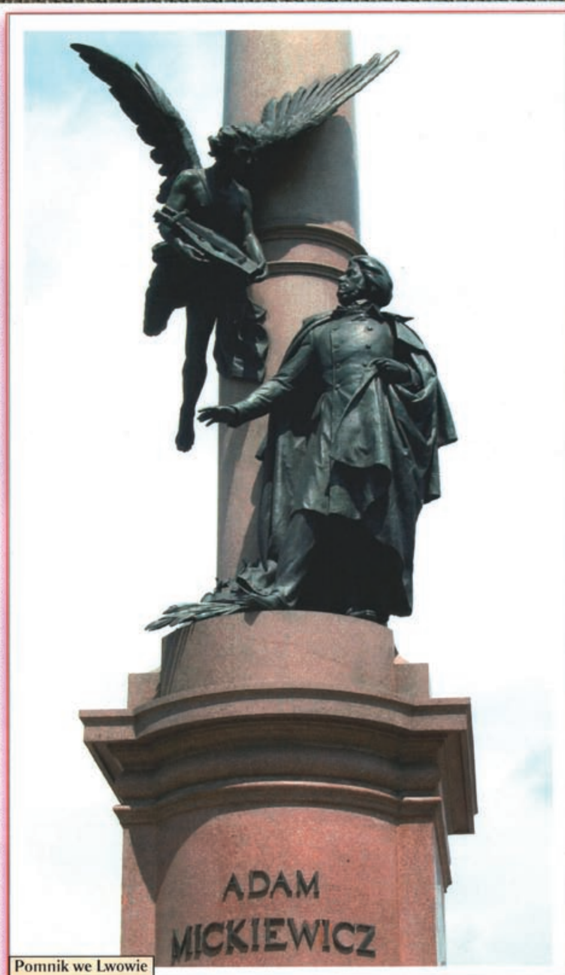
Pomnik we Lwowie